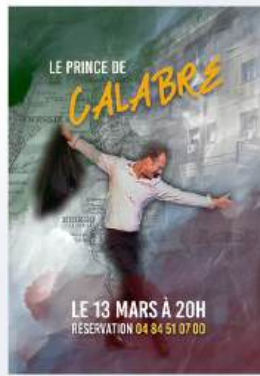
LE PRINCE DE CALABRE THÉÂTRE - 50 REPRÉSENTATIONS