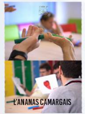
DOCUMENTAIRE CO-PRODUCTION POLY-HANDICAP ET PEINTURE