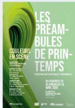
CO-RÉALISATION DEPUIS 2018