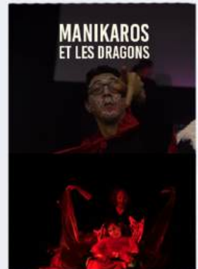
DOCUMENTAIRE CO-PRODUCTION POLY-HANDICAP ET THÉÂTRE