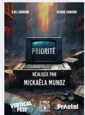
DISTINGUÉ AU VERTICAL FEST COURT MÉTRAGE DE FICTION

Créée en 2021, Le Cercle des Lucioles développe des projets artistiques dans tous les champs de l'art, laboratoire de formes les plus diverses, tel que la musique, le théâtre, la pédagogie, le cinéma et le documentaire.