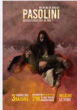
PASOLINI - CRÉATION 2026